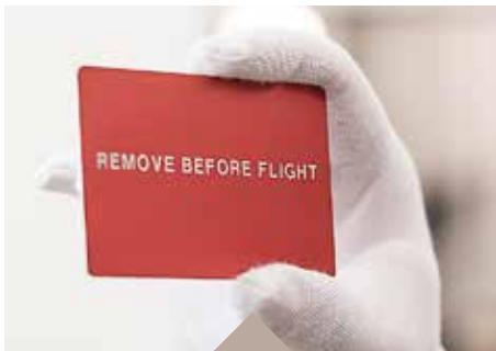
Kontrastreiches Laserabtragen auf rot eloxiertem Aluminium

Die Werkstückoberfläche wird durch Erwärmung verfärbt, je nach Basismaterial sind unterschiedliche Farbspektren möglich. Auf der Oberfläche entsteht eine dünne Oxidschicht, sie bleibt dabei unbeschädigt. Die Anwendung ist für Chrom-Nickel-Stahl oder Titan geeignet.