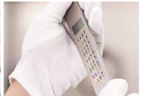
Mögliches Farbspektrum auf Titan für das Laserbeschriften mittels Anlassen