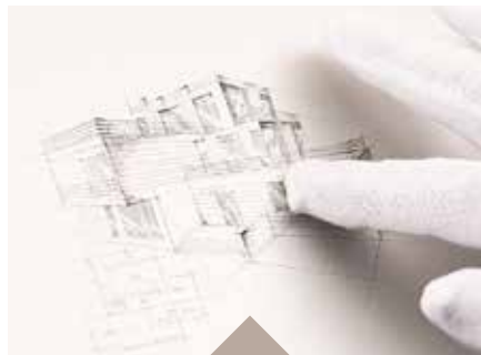
Blackmarking mit feingliedriger Grafik auf farblos eloxiertem Aluminium